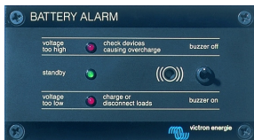
Tableau 'Battery Alarm'

Alarme visuelle et sonore en cas de tension batterie trop haute ou trop basse. Seuils de déclenchement réglables. Contact sec pour signalisation déportée.