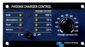
Tableau 'Phoenix Charger Control'

Alarme visuelle et sonore en cas de tension batterie trop haute ou trop basse. Seuils de déclenchement réglables. Contact sec pour signalisation déportée.